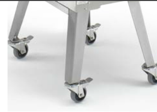
Gambe con ruote Legs with wheels