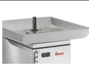
Tramoggia gigante Larger feed tray