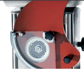
Format M Format M