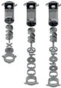
Standard o enterprise 1/2 Unger Unger Totale