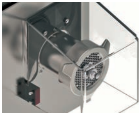
Protezione bocca per piastra con foro \varnothing > 8 mm Safety device for \varnothing > 8 mm plates.