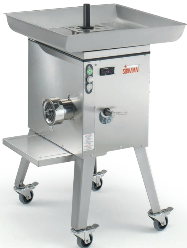
TC 32 BUFFALO ICE

Optionals: tramoggia gigante, gambe con ruote e piano estraibile larger feed tray, legs with wheels and removable tray holder