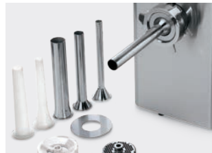
Kit insacchire Stuffer kit