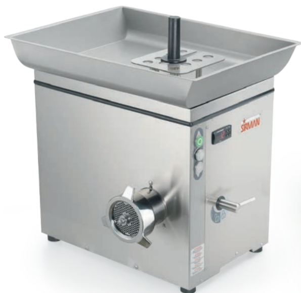
TC 32 BUFFALO ICE