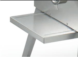
Supporto vassoio Tray support